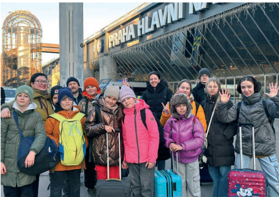
Exkursion nach Prag für die Jugendlichen der Gemeinde Augsburg.

Ein besonderer Moment des Abends war der Geschichte des Festes gewidmet. Wir sahen zwei interessante Videos, eines davon handelt vom Jüdischen Nationalfonds (KKL-JNF). Es war bewegend zu begreifen, dass hinter jedem der 240 Millionen Bäume, die der Fonds seit 1901 gepflanzt hat, eine menschliche Hand und guter Wille stehen. Dieses Video erinnerte