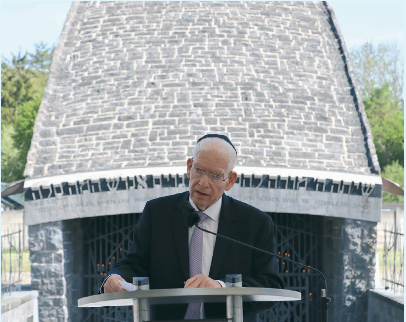
81. Jahrestag der Befreiung Dachau: Akt der Erinnerung, siehe dazu auch Seite 8.