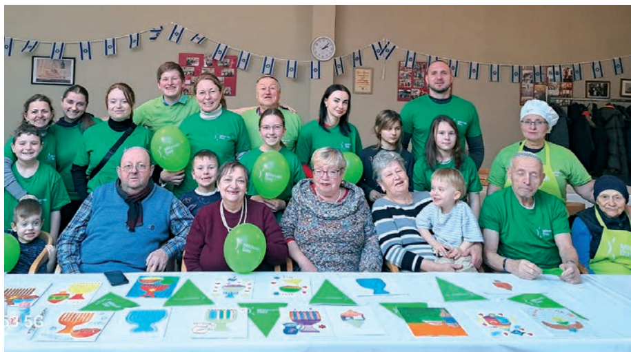
Mitzvah Day in der Gemeinde Hof.