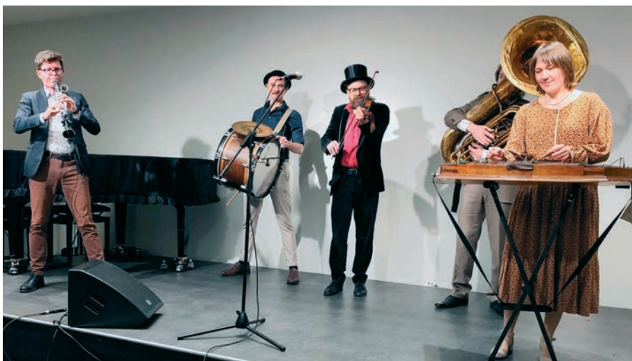
Konzert mit der Band Dobranotch in der Gemeinde Regensburg.