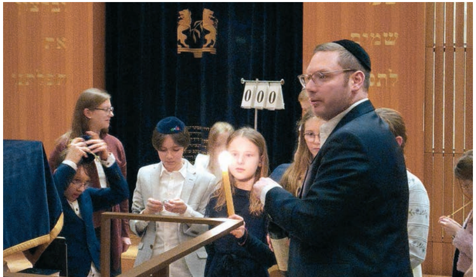
Bat Mizwa in der Gemeinde Regensburg.

Im Anschluss fand ein feierlicher Kidusch statt. Neomi und ihr Vater wandten sich mit persönlichen und herzlichen