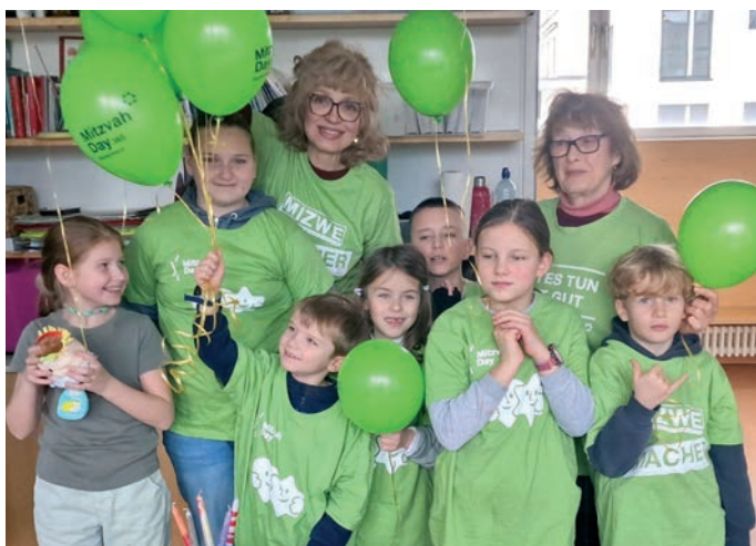
Mitzwa Day in der Gemeinde Würzburg.

Purim begann in der Synagoge mit dem Abendgottesdienst und der Lesung der Megillat Esther. Danach trafen sich die Gäste zu einer festlichen Begegnung im David-Schuster-Saal. Dort waren die Tische mit traditionellen Purim-Leckereien gedeckt. Außerdem wurde eine Ausstellung mit Arbeiten der Kreativwerkstatt ge-