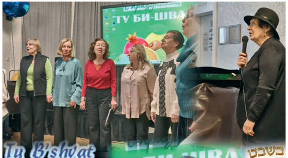
Tu Bischwat in der Gemeinde Augsburg.

Hauptziel der Schule ist die ganzheitliche Entwicklung des Kindes, das Kennenlernen jüdischer Kultur, Traditionen und Geschichte sowie die Förderung von Wissensinteresse in einer freundlichen und unterstützenden Umgebung.