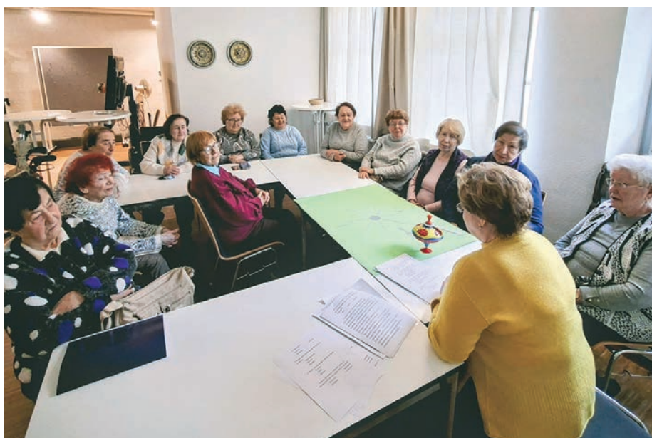
Der intellektuelle Klub der Gemeinde Bamberg.