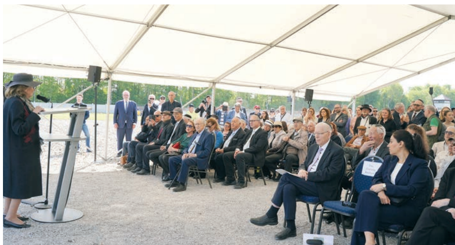
Gedenkfeier der Jüdischen Gemeinden.

Wer sich auf die Geschichte nicht aktiv einlässt, für den kann schnell der Eindruck entstehen, was damals geschehen ist, sei für uns heute ohne direkte Bedeutung. Also etwa so: Der Nationalsozialismus hat himmelschreiendes Unrecht begangen, aber diese Zeit ist zum Glück vorbei. Die Nazis sind besiegt, das Thema ist erledigt. Oder nicht? Ich sage: Nein! Denn dieses Denken ist es erst, das die Gefahren der Geschichte wieder zurückbringt. Diese Geisteshaltung hat der kluge Hape Kerkeling, selbst Enkel eines Überlebenden, vor wenigen Wochen ... als „Bequemlichkeit des Wegsehens“ beschrieben. Er meinte damit nicht nur das Abwenden der Augen, sondern vor allem auch die Trägheit der Herzen. Kerkeling münzte seine Formulierung auch ausdrücklich nicht auf die historische Situation, ... sondern er sprach vom Jetzt: von der Demokratie, die jede Generation neu für sich verteidigen müsse. Weil, das füge