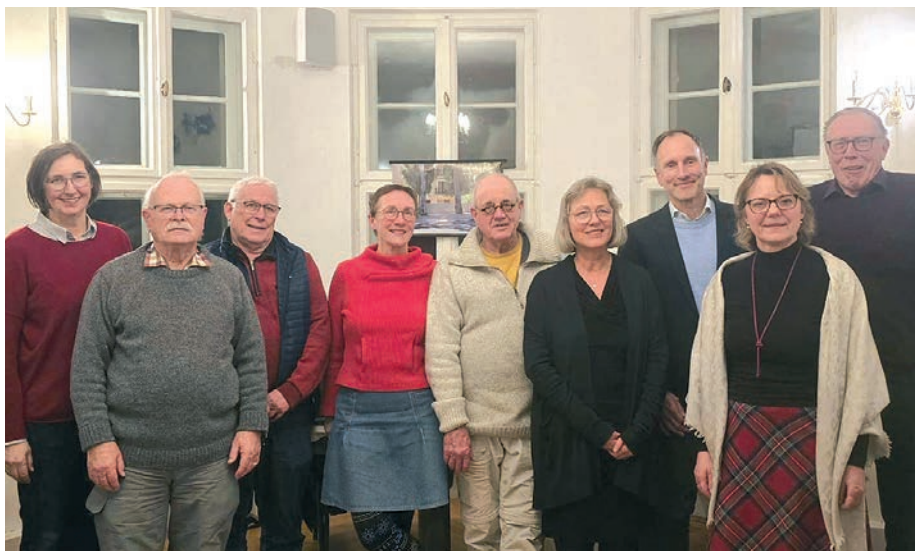
Der Vorstand des Freundeskreises der Gemeinde Erlangen.

Anfang Dezember fand in der Waldorfschule ein besonderes „Konzert für den Frieden“ statt. Die Band Sistanagila verband in ihrem Programm jüdisch-persische Musiktraditionen mit westlicher Klassik und schuf so einen musikalischen Dialog zwischen verschiedenen Kulturen. Mit den Instrumenten Geige, Gitarre, Saxofon und orientalischer Percussion entstand ein vielfältiges Klangbild, das das Publikum begeisterte. Gerade vor dem Hintergrund der aktuellen Entwicklungen im Iran und der Solidarität Israels mit der iranischen Bevölkerung erhielt der Abend eine besondere Bedeutung. Die Musik erinnerte daran, wie eng kulturelle Verbindungen zwischen Menschen sein können, auch über politische Konflikte hinweg. Organisiert wurde das Konzert von der Jüdischen Gemeinde in Kooperation mit der Freien Waldorfschule und mit Unterstützung des Zentralrats der Juden.