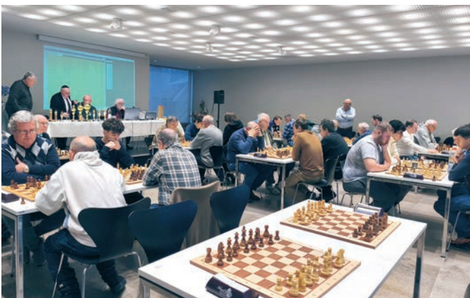
Otto-Schwerdt-Schachturnier in der Gemeinde Regensburg.