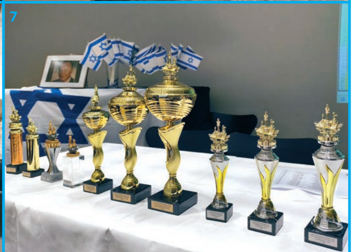
Die Bildunterschriften finden Sie auf Seite 2, Beiträge zu den Bildern im Heft.