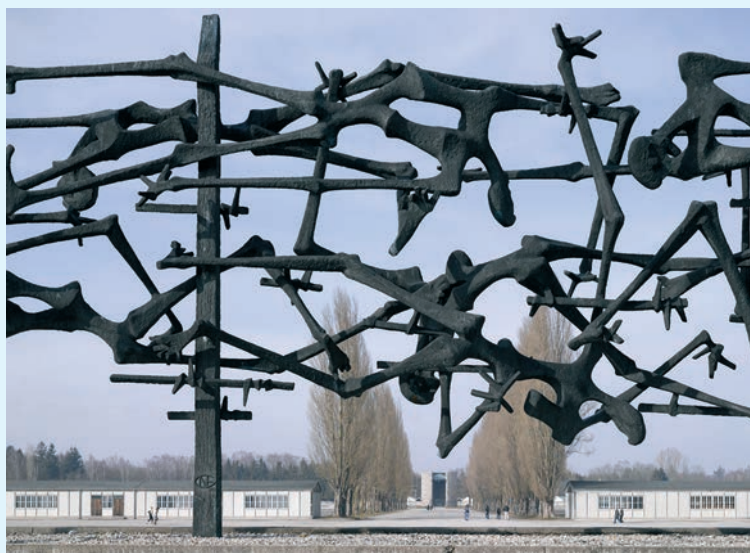
Teil des Internationalen Mahnmals von Nandor Glid in der KZ-Gedenkstätte Dachau, siehe hierzu auch Seite 8.

Barbara Honigmann: Mischka, Drei Porträts , 112 S., Hanser Verlag, München 2026, www.hanser-literaturverlage.de .