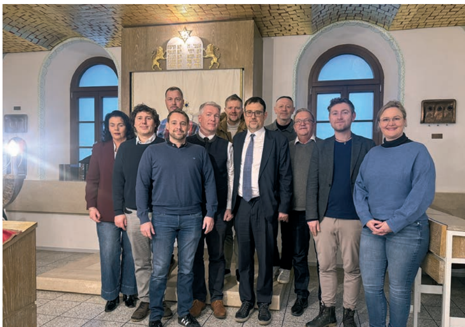
Besuch der CSU-Fraktion und der FDP-Fraktion in der Gemeinde Amberg.

Drei Tage, vom 28. bis 31. Dezember, verbrachten die Jugendlichen in der Hauptstadt Tschechiens – sie spazierten, hatten Spaß und erkundeten die Stadt, wobei sie viele Kilometer in dieser wunderbaren Stadt zurücklegten.