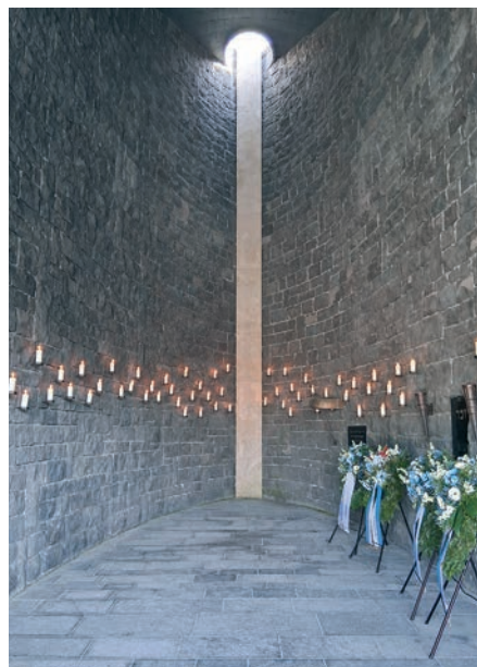
Die jüdische Gedenkstätte im ehemaligen KZ-Dachau.

Warum mahnen wir dies heute so eindringlich an? Weil wir spüren, dass sich das gesellschaftliche Klima in unserem Land auf gefährliche Weise verschärft. Wir erleben eine Verrohung des Diskurses, die uns zutiefst beunruhigen muss. Das zuvor Undenkbare wird wieder sagbar. Heute wird wieder verhandelt, was eigentlich unantastbar sein sollte: die Sicherheit jüdischen Lebens als selbstverständlicher Teil der deutschen Gesellschaft ... Lassen Sie uns daher nicht nur passive Wächter der Erinnerung sein. Lassen Sie uns aktive Verteidiger unserer Gegenwart sein.