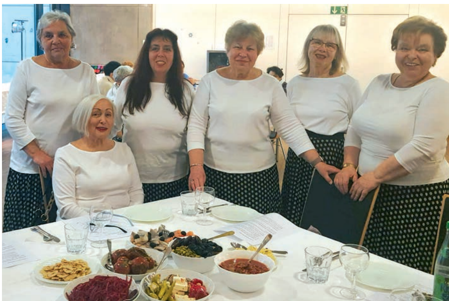
Das Neujahrsfest der Bäume in der Gemeinde Bamberg.