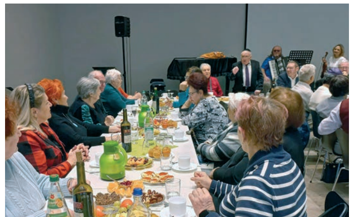
Zu Gast bei Freunden in der Gemeinde Regensburg.