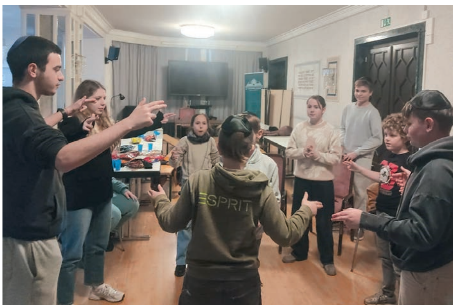
Sonntagsschule in der Gemeinde Augsburg.

Der Unterricht findet jeden Sonntag von 10:00 bis 14:00 Uhr statt, was sich gut in den Familienalltag einfügt. In diesen vier Stunden tauchen die Kinder in ein abwechslungsreiches und intensives Programm ein, das Lernen, Kreativität und aktive Erholung miteinander verbindet.