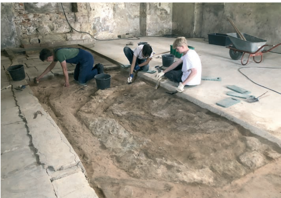
Schüler bei Ausgrabungsarbeiten in der alten Synagoge Mühlhausen.