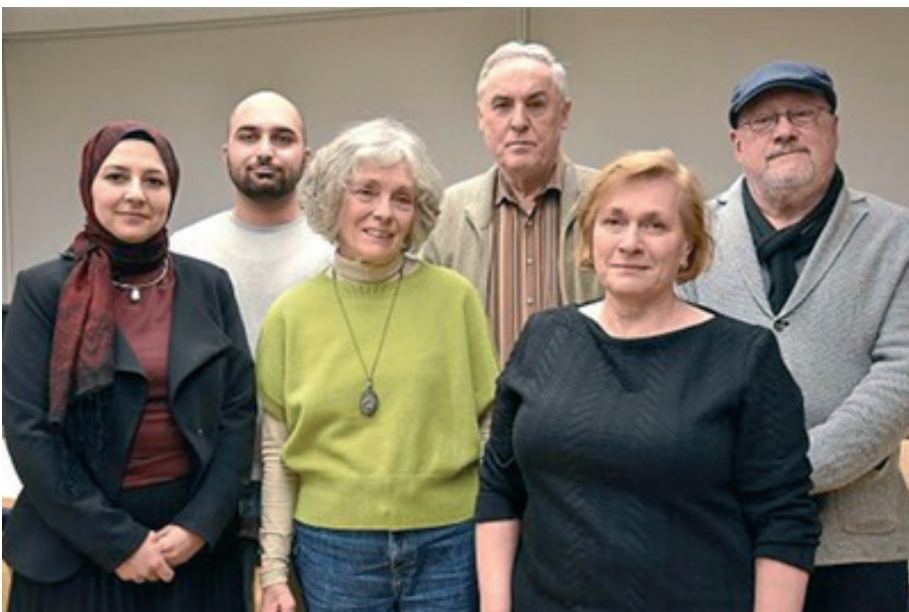
Religionsgespräch in der Gemeinde Straubing.