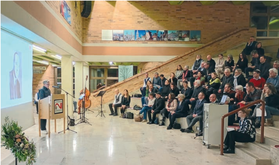
Gedenkstunde der Gemeinde Regensburg.

können wir auf 21 Jahre zurückblicken. Tradition ist ein fester Bestandteil im Judentum.“