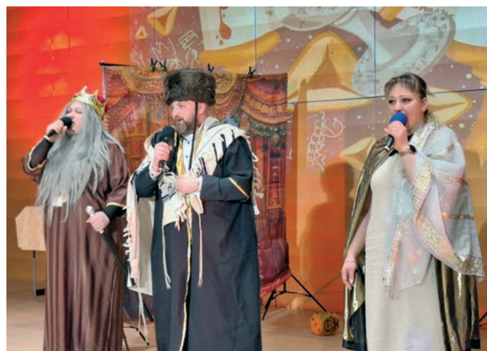
Purimspiel in der Gemeinde Würzburg.