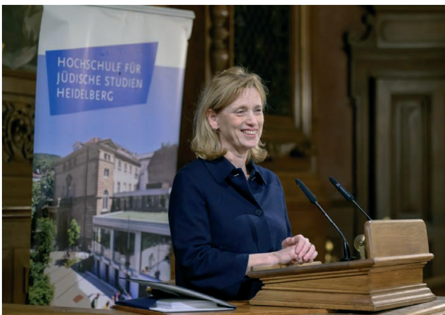
Bundesministerin Karin Prien.

Um dieses Schutzversprechen einzulösen, galt Bildung als ein zentraler Schlüssel. Und Bildung hat, so empfinde ich es, dieses Versprechen auch in Teilen eingelöst. Doch der 7. Oktober 2023 und seine Folgen haben diese Gewissheit erschüttert. Ebenso das Vertrauen in den Erfolg von Bildungsarbeit gegen Antisemitismus. Die Welle der Gewalt gegen Jüdinnen und Juden weltweit, die Rechtfertigungen von antisemitischen Übergriffen, die Relativierungen und vor allem die Sprachlosigkeit: Sie haben mehr als deutlich gemacht, wie schnell demokratische Grundwerte ins Wanken geraten: Werte wie die unantastbare Würde des Menschen, wie das klare Ächten von Hass und Willkür gegen Gruppen.